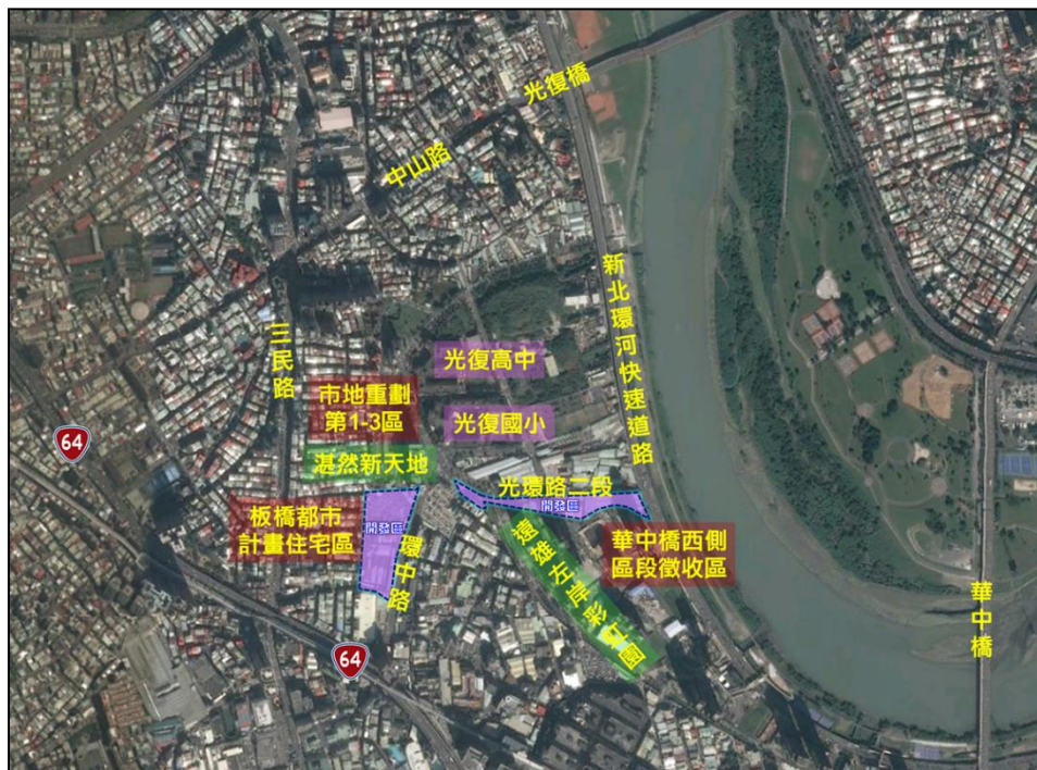
圖 1 區段徵收範圍示意圖

本計畫區位於新北市板橋區及中和區交界，東臨新北環河快速道路，西鄰板橋都市計畫(板橋三民路二段 245 巷)之住宅區，南接中和都市計畫區(中和華中橋西側區徵區)，北至光環路二段，係屬「擬定板橋都市計畫(部分埔墘地區)(配合臺北都會區環河快速道路臺北縣側建設計畫)細部計畫(區段徵收第 4-7 區及工業區範圍)案」，都市計畫面積約為 4.36 公頃(圖 2)，然工業區部分範圍內既存合法建物，已作工業廠房及其他符合規定之使用，爰將原區內乙種工業區排除區段徵收範圍，改採開發許可方式辦理，爰僅就第 4-7 區範圍辦理區段徵收，其面積約 3.74 公頃(圖 1)。